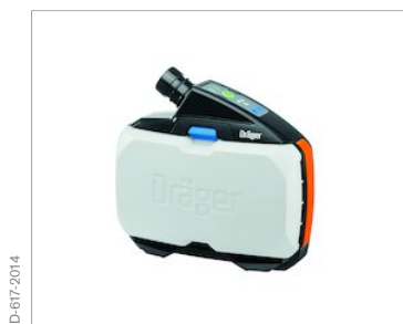
Dräger X-plore® 8500